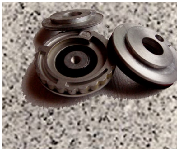
PLATOS ESPIRAL - VELCRO EN ALUMINIO Y PLASTICO CON Y SIN FLECTOR