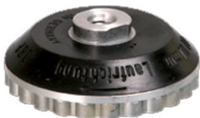
ACOPLAMIENTO R 1/2" - M-14 A Espiral o Caracol