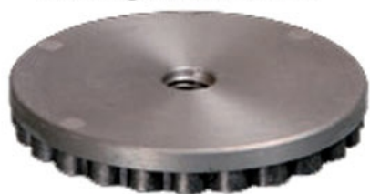
Plato con Amortiguador de Goma