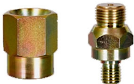
Adapatador Rosca GAS 1/2" A M-14 Con orificio para agua

El adaptador permite el paso de agua por el eje central, refrigerando y aportando el agua necesaria para los proceso de pulido con muelas de acoplamiento espiral o caracol o platos con sistemas de fijación por velcro para las clásicas lijas de diamante flexibles o cualquier otra herramienta de fijación por velcro, permitiendo un huso mas universal de los CNC.